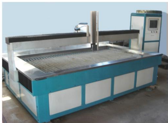
CORTADORA DE AGUA