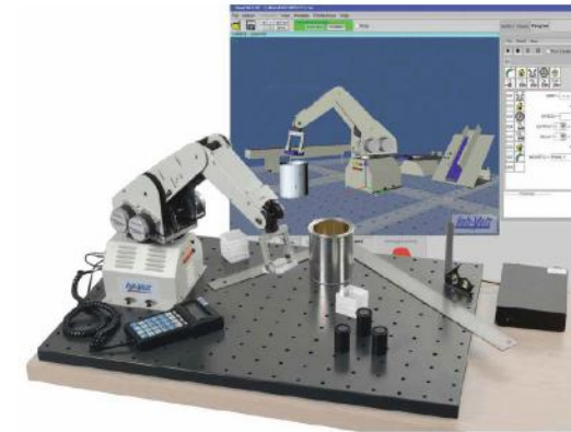
SISTEMA DE ENTRENAMIENTO EN ROBÓTICA DIDÁCTICO MODELO 5150