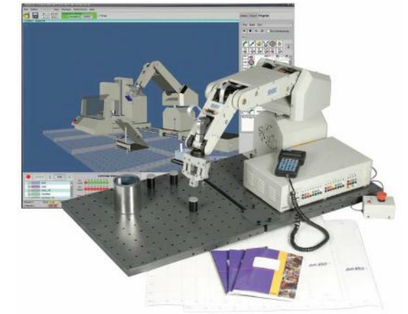
INDUSTRIAL MODELO 5250