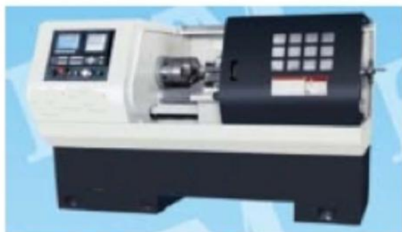
TORNO CNC INDUSTRIAL