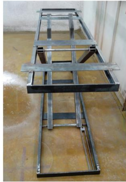
SISTEMA DE HERRERÍA HIDRÁULICA