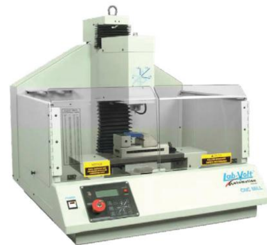
FRESADORA DIDÁCTICA CNC MODELO 5600